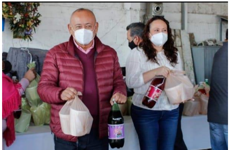
Sillas de ruedas Cenas navideñas