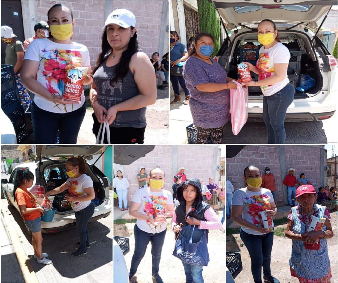
2,500 litros de leche