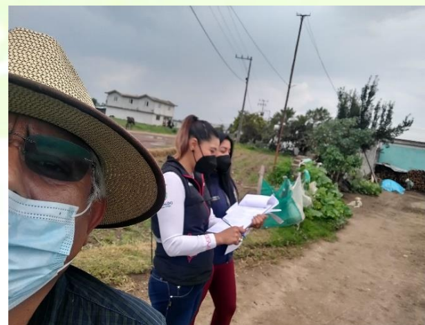
Recepción de documentos para el programa cuartos rosas.