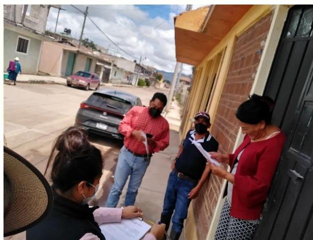
Conformación del comité para la ampliación de la red eléctrica.