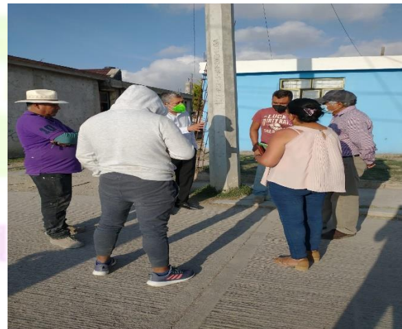
Reunión de vecinos en Santa Hueytlalpan centro.