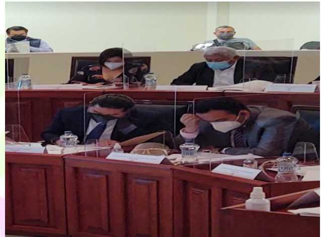
Sesión de trabajo.