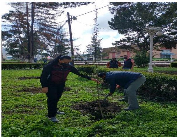
Siembra de árboles en los edificios de la colonia Nuevo Tulancingo Sección C