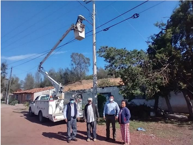
Mantenimiento al alumbrado público.