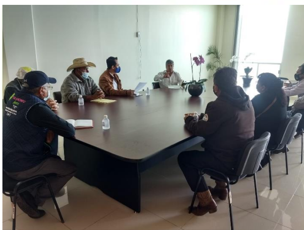
Reunión de trabajo con vecinos de la colonia Francisco Villa para tratar temas relacionados al agua.