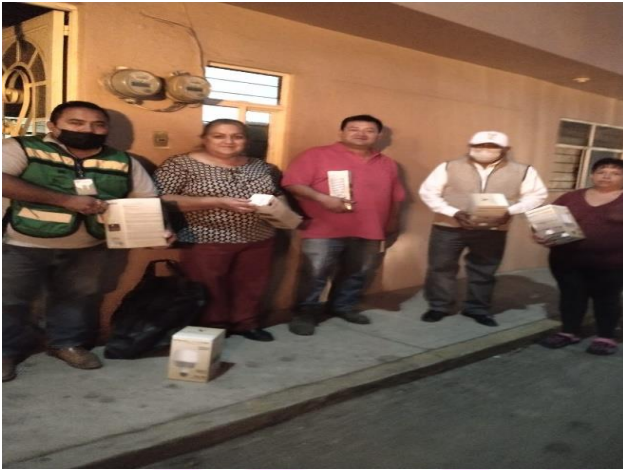
Entrega de focos.