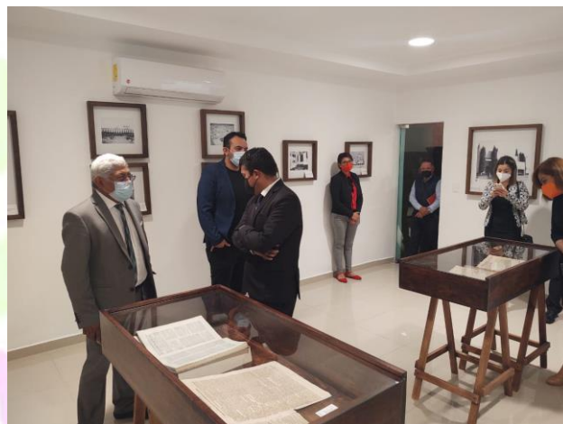
Visita al Congreso del Estado para el curso taller "Facultad Reglamentaria Municipal".