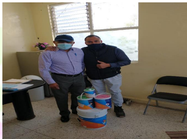
Entrega de pintura para el rastro municipal.