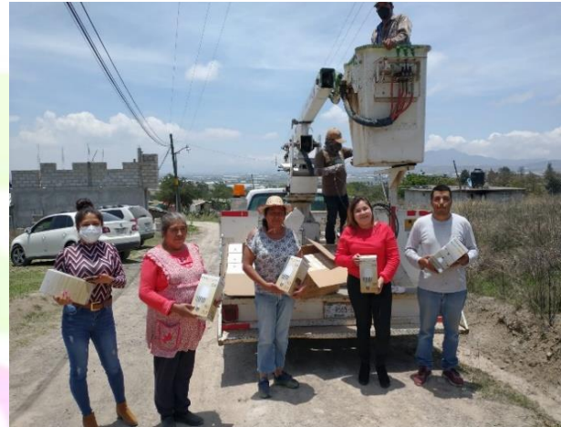
Entrega y colocación de focos en comunidad Tepalcingo.