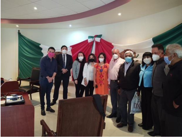
Reunión de trabajo con el presidente municipal.