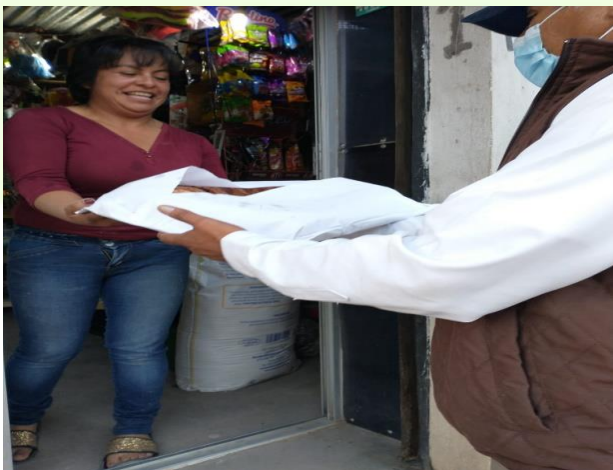
Con motivo del 6 de enero se entregaron roscas en las diferentes colonias.