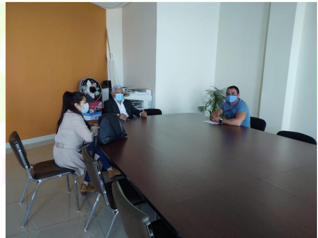
Reunión con el presidente de la Asociación de pipas de agua del valle de Tulancingo.