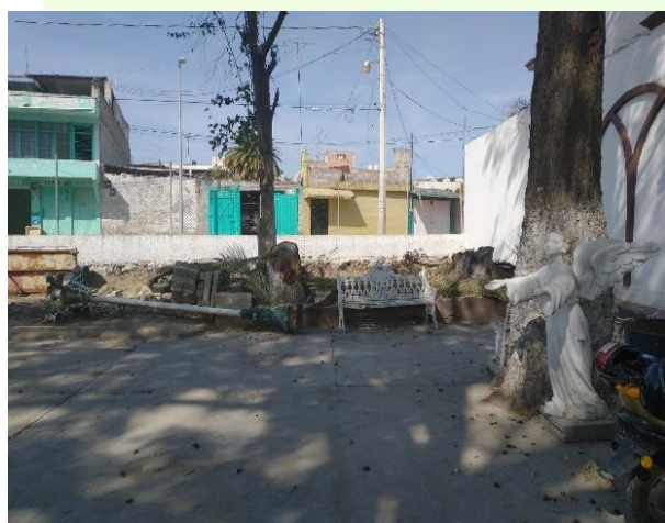
Recorrido al panteón municipal para conocer las condiciones en que se encuentra.