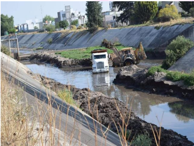
Trabajos de mantenimiento en el río Tulancingo.