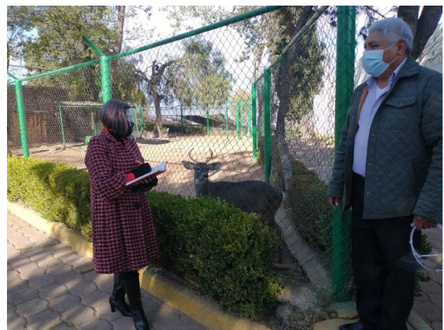
Visita al zoológico.