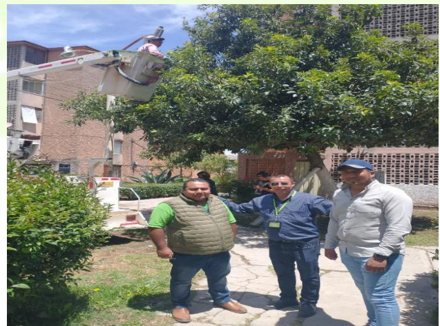
Colocación de focos.