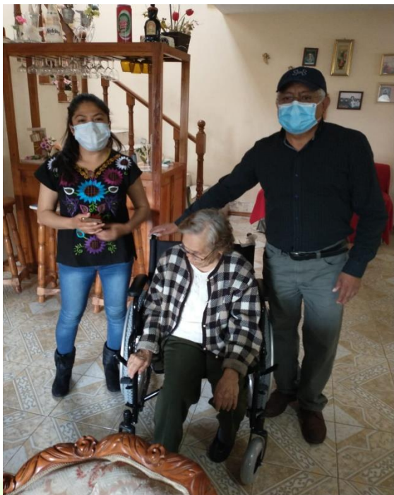
Apoyo de silla de ruedas.