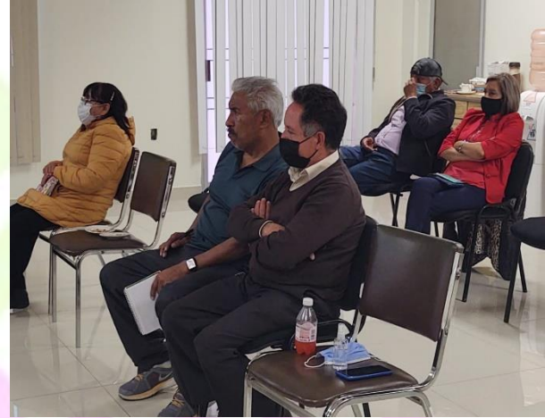
Consulta ciudadana para la apertura de una tienda comercial.