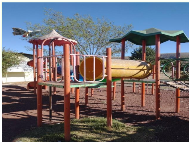
Reparación de juegos infantiles.