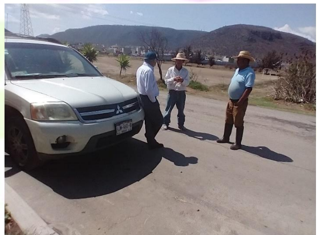
Atención a vecinos de Santa Ana Hueytlalpan