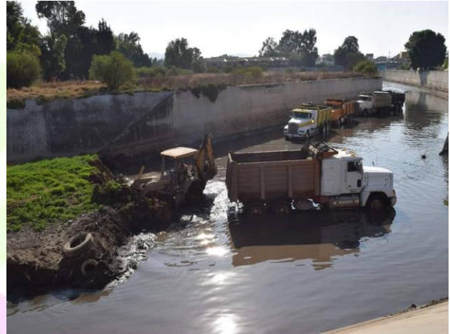
Trabajos de mantenimiento en el río Tulancingo.