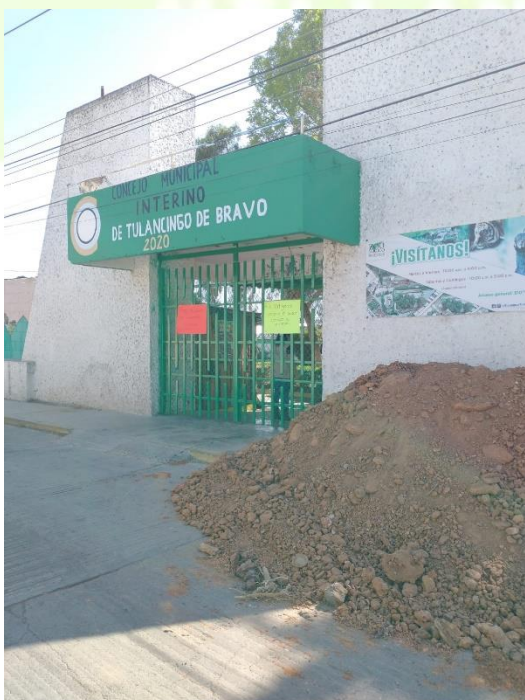
Apoyo con material para la mejora de jaulas en el zoológico municipal.