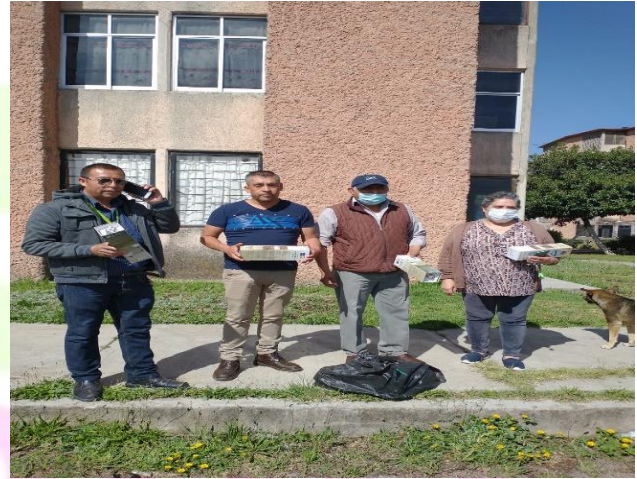
Entrega de focos en los edificios del Nuevo Tulancingo Sección C.