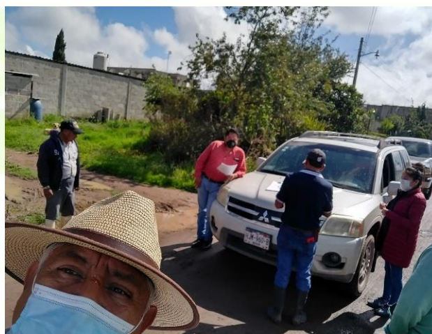
Comité para la ampliación de la red eléctrica.