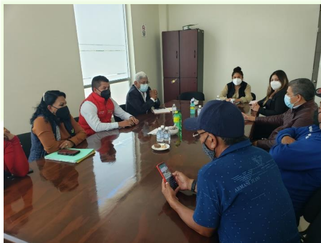
Reunión de trabajo de empoderamiento con los vecinos de la Zona 5.