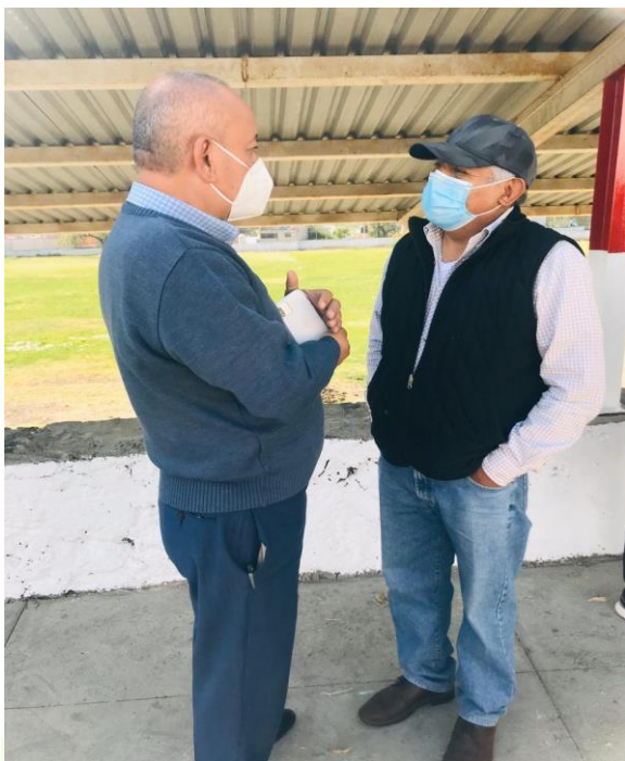
Plática con la presidente municipal relacionada con la problemática del municipio.