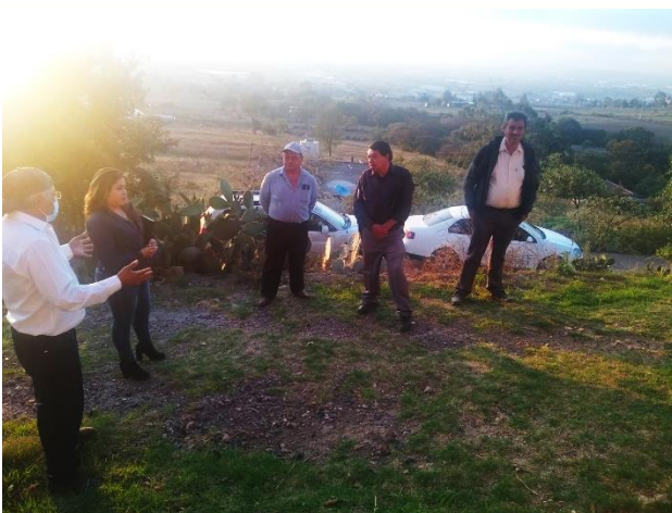
Reunión con vecinos de Tepalcingo.