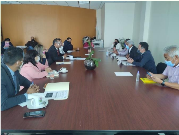
Integración de la comisión de servicios municipales.