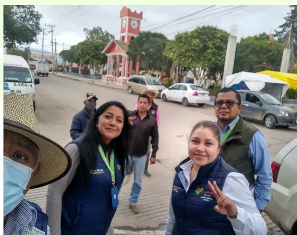
Validación de familias del programa cuartos rosas.