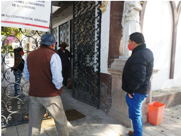
Visita al panteón municipal.