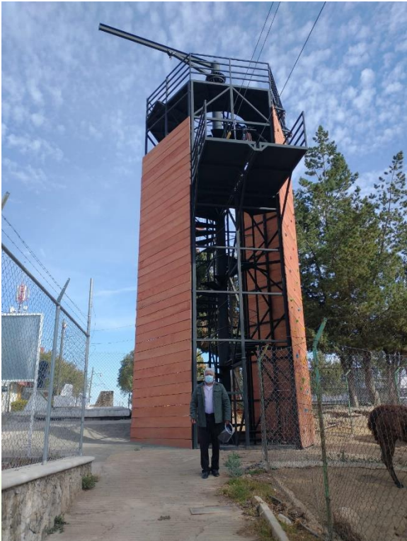
Visita al Zoológico del Municipio.