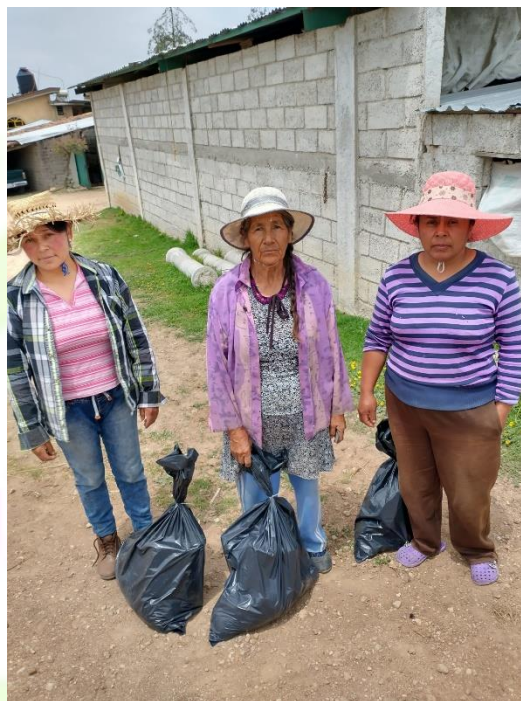
Apoyo de despensas en el barrio Axatempa.