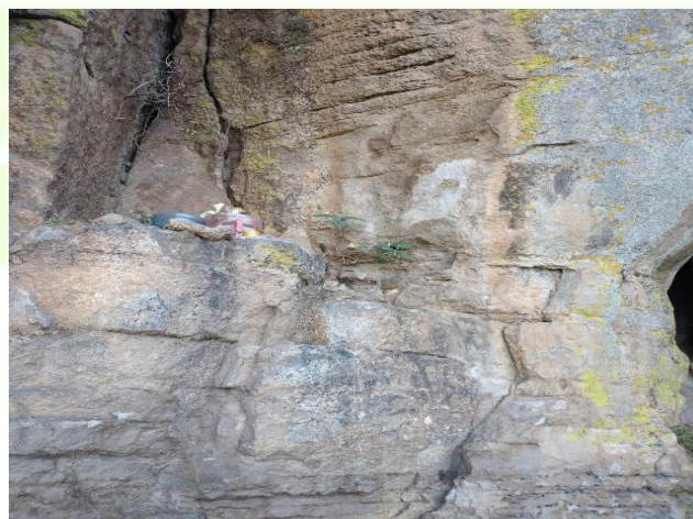
Visita a la zona arqueologica de Hupalcalco