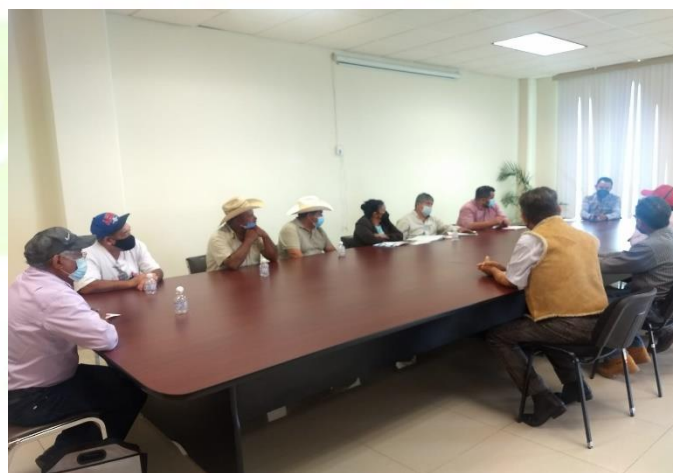
Reunión de trabajo con vecinos de la colonia Francisco Villa para tratar temas relacionados al agua.