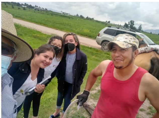
Visita de trabajo en barrio Axatempa.