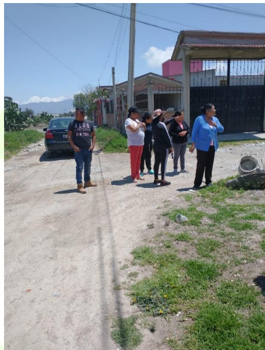
Identificación de lámparas que no funcionan.