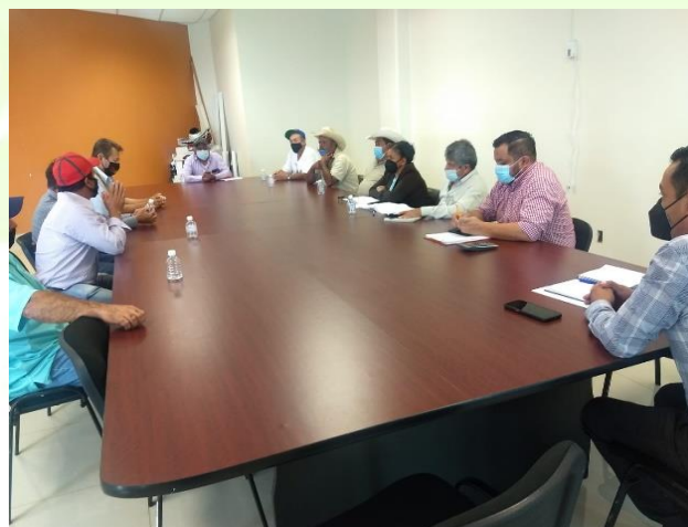
Reunión de trabajo con vecino de la colonia Francisco Villa en relación al agua.