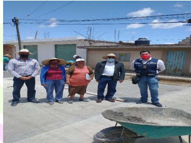
Reunión con el comité de obra de la calle 3 de mayo en Santa Ana Hueytlalpan.