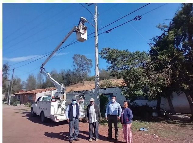
Colocación de focos.