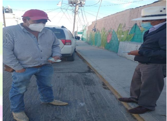
Apoyo economico para el zoologico de Tulancingo.