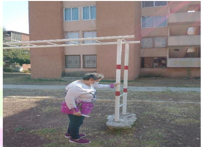
Reparación de juegos en infantiles en el Nuevo Tulancingo Seccion C.