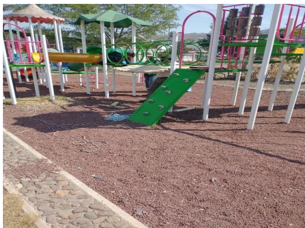
Reparación de juegos infantiles en colonia Real de Minas.