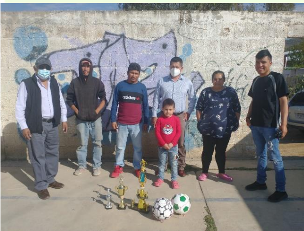
Apoyo de materia deportiva para Viveros de la loma.