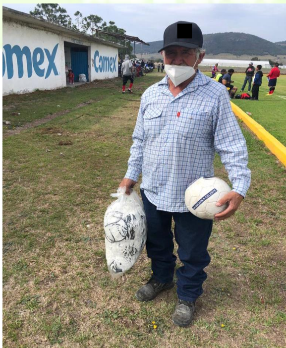
Apoyo para el equipo de futbol de Santa Ana Hueytalpan (Redes de portería y un balón) .