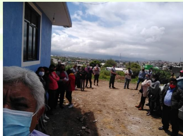
Comité para la ampliación de la red eléctrica.