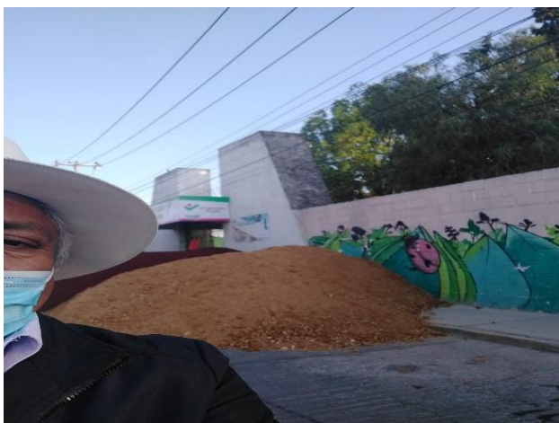
Material para emparejar los corrales de los animales en el zoológico de Tulancingo.