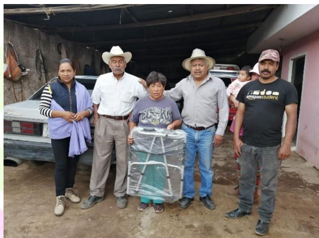
Apoyo de una andadera para una persona discapacitada.