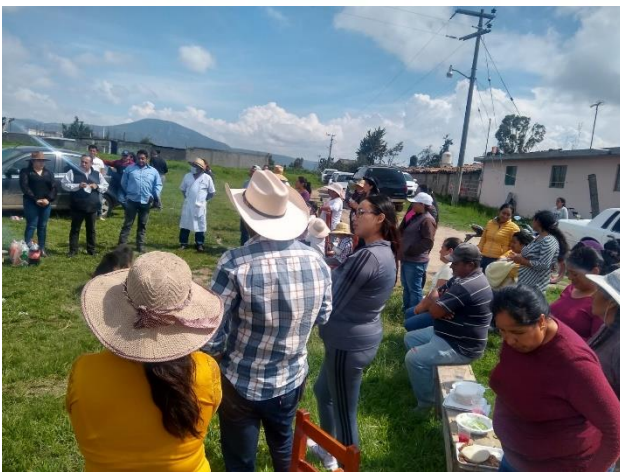
Reunión de trabajo con vecinos del barrio Axatempa, Santa Ana Hueytlalpan.