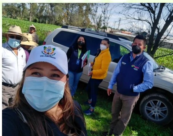
Recepción de documentación para el programa cuartos rosas.