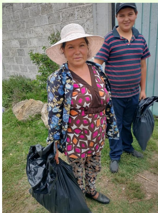
Apoyo de despensas en el barrio Axatempa.