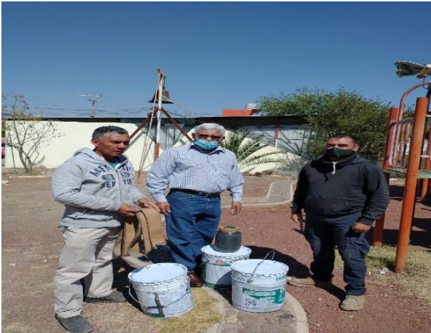
Entrega de pintura para la reparación de los juegos infantiles de la colonia Real de minas.