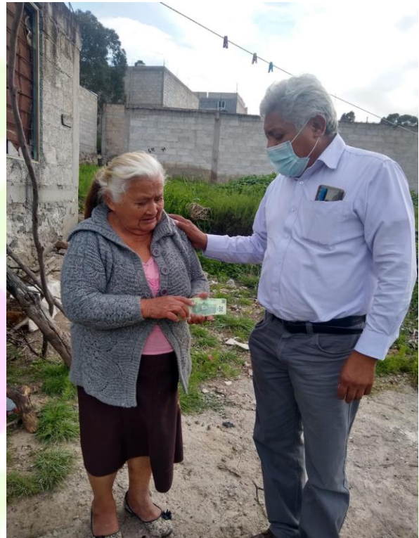
Apoyo económico para el techado de casa habitación .