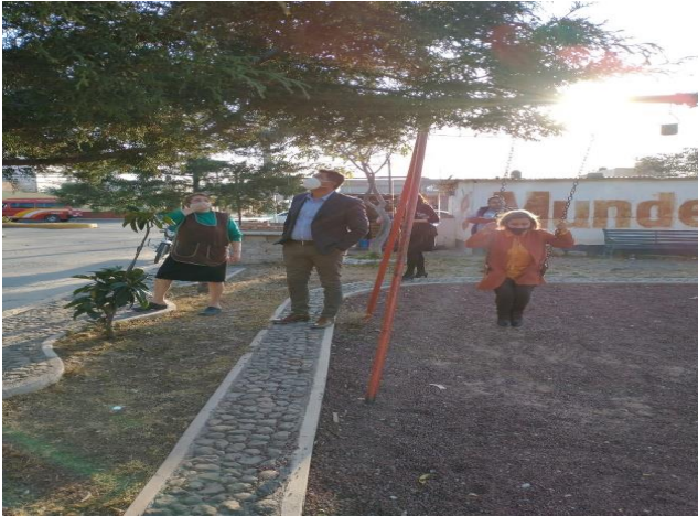
Verificar el área de los juegos infantiles en colonia Real de minas.