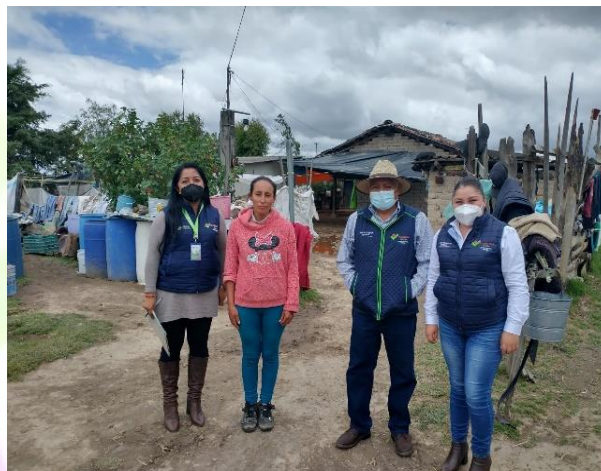
Validación del programa cuartos rosas.