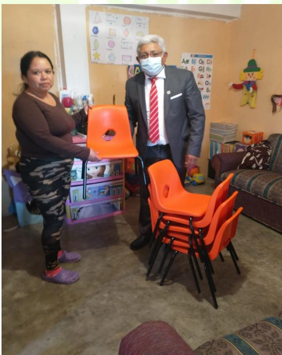
Apoyo para el equipo de futbol de Santa Ana Hueytalpan (Redes de portería y un balón) .