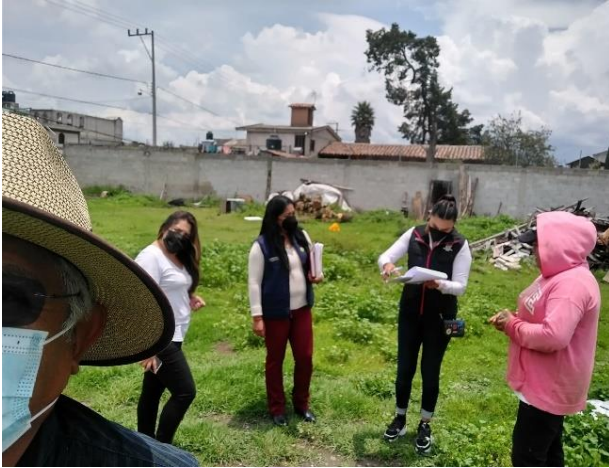
Recepción de documentos para el programa cuartos rosas.