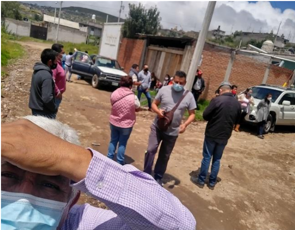
Reunión con vecinos de Lomas de los Pinos.