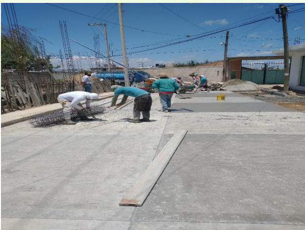
Visita a los trabajos de pavimentación de la colonia 3 de mayo.