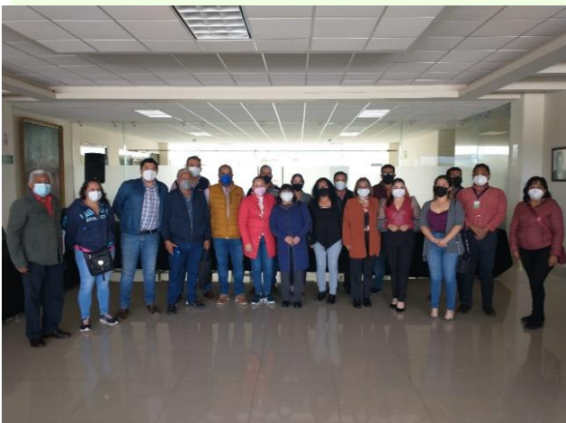
Reunión de trabajo con el comité de regularización de lotes y/o terrenos Ampliación Rojo Gómez.