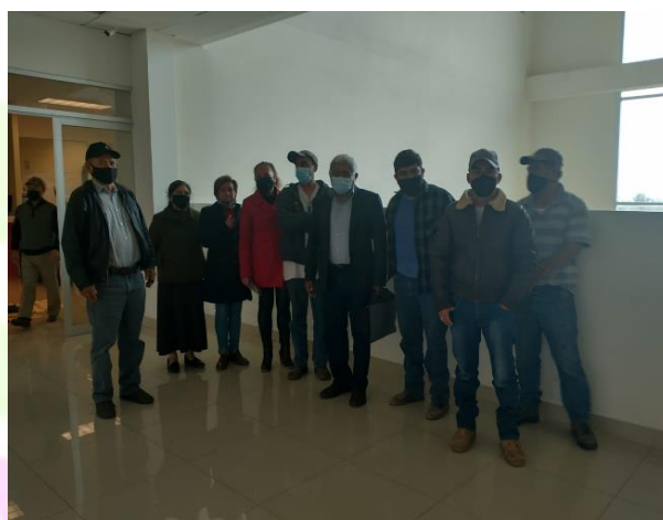
Reunión con vecinos de la colonia El Paraíso.