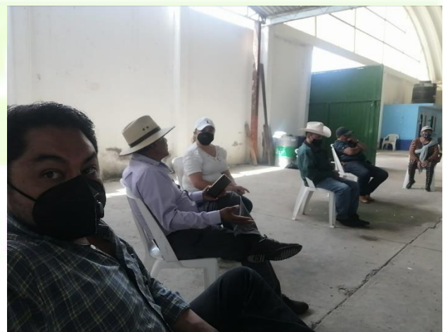
Reunión de trabajo con los ex comisariado y comisario actual de Santa Ana Hueytalpan.