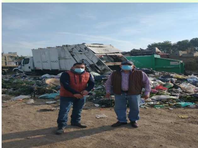
Visita a COSEPLAT