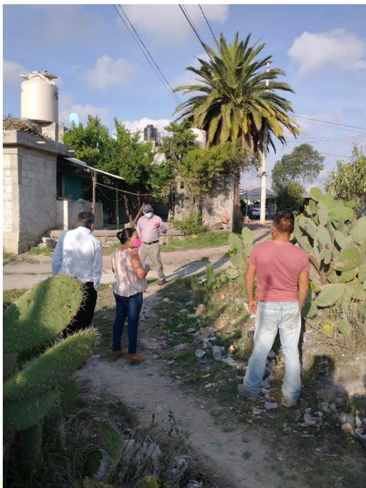
Identificación de lámparas que no funcionan.