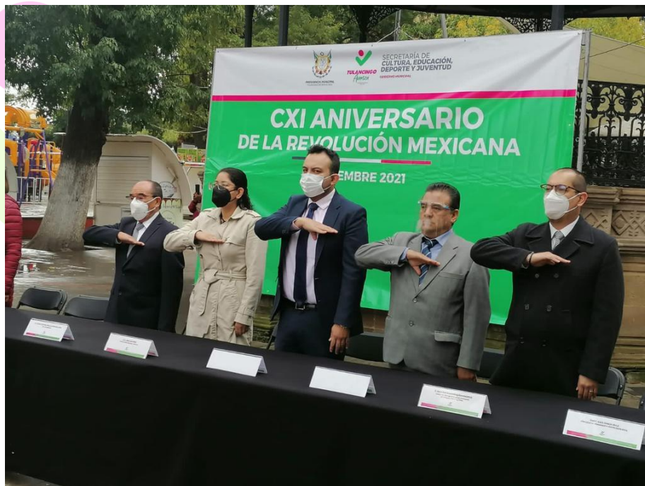
CXI Aniversario de la Revolución Mexicana