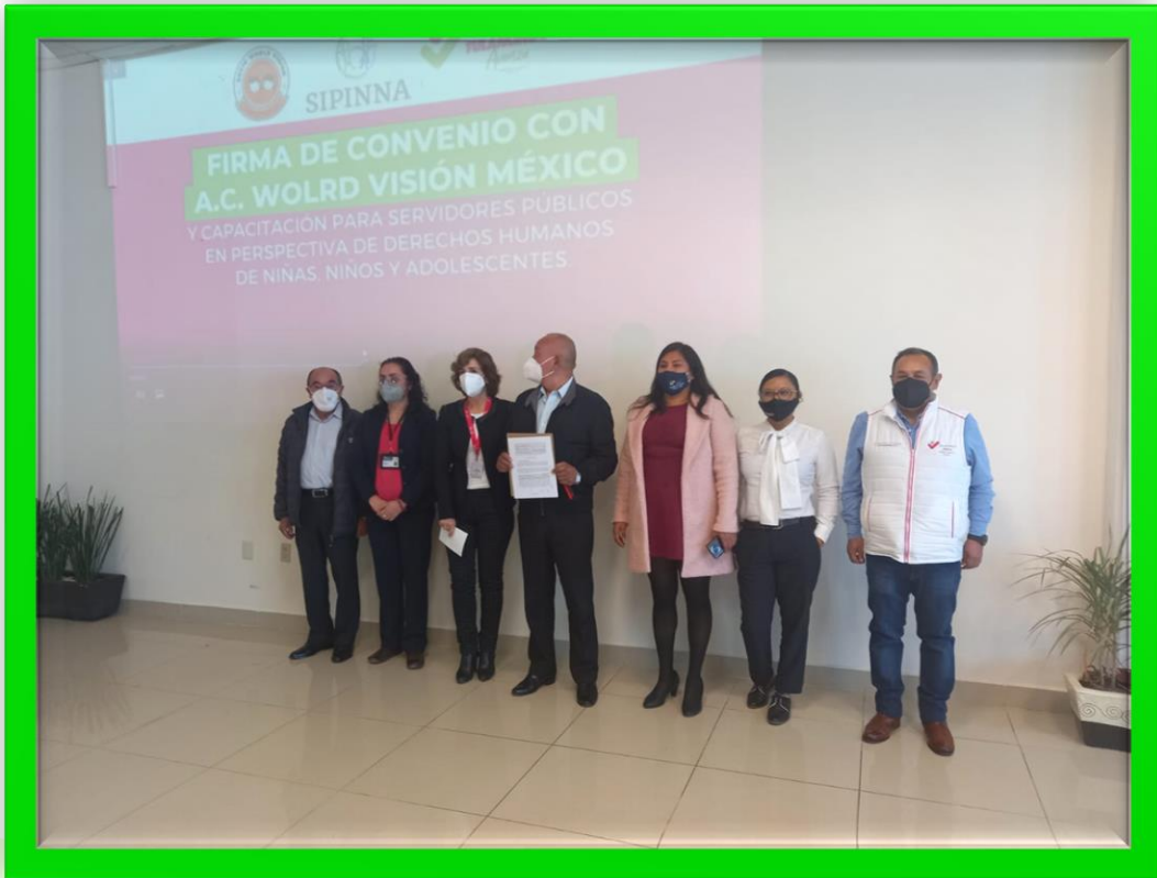
Firma de Convenio con la A.C. World Visión México SIPINNA”