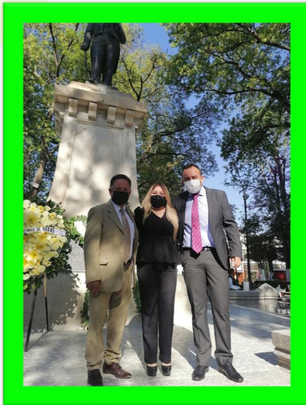
En el monumento a Juárez en su Aniversario Luctuoso