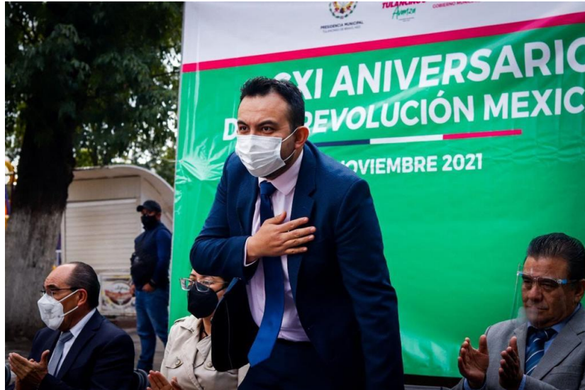
Acudí al evento del CXI Aniversario de la Revolución Mexicana