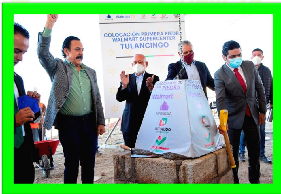
Se llevo a cabo la colocación de la Primera Piedra del Centro Comercial Walmart Tulancingo a cargo del Gobernador del Estado de Hidalgo