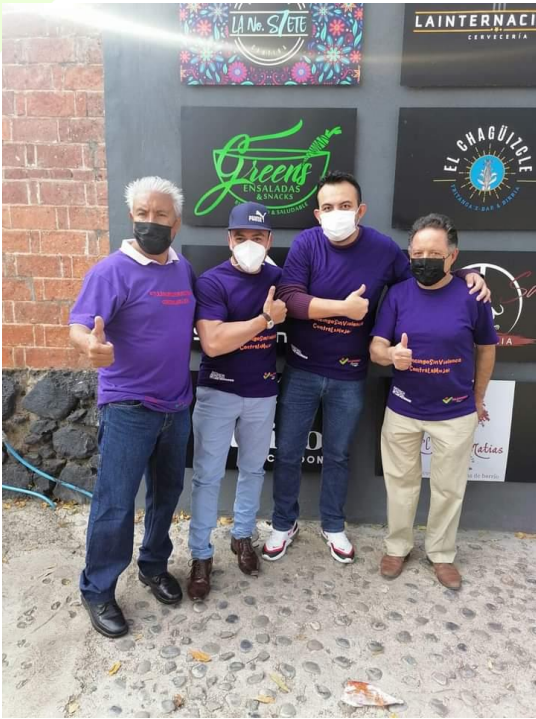
Tulancingo sin Violencia contra la Mujer