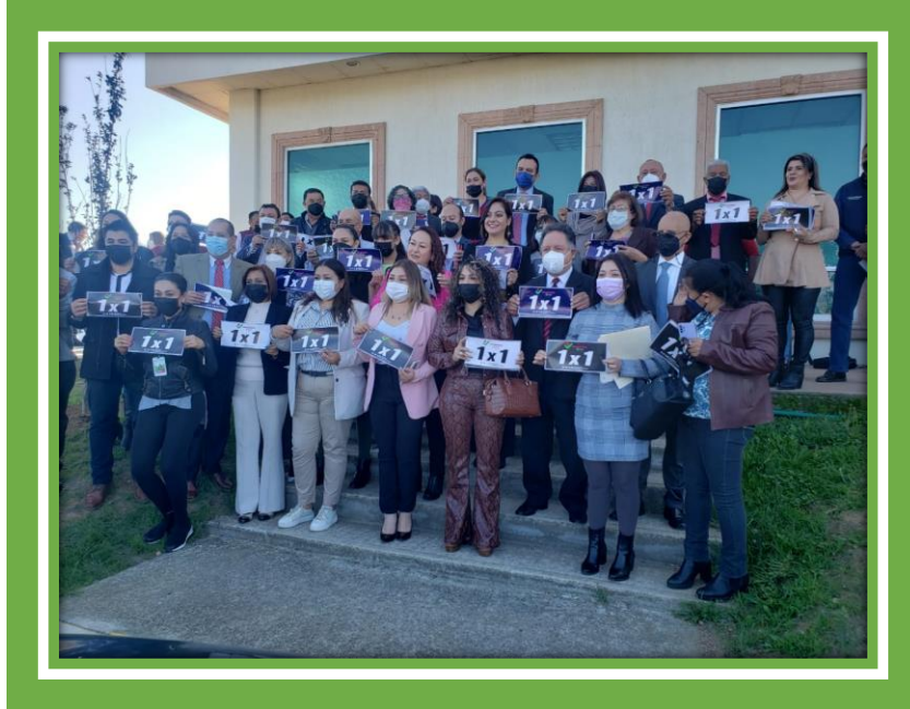
Acompañe al Presidente Municipal a la presentación del programa 1 X 1 a cargo de la Dirección de Movilidad y Transporte.