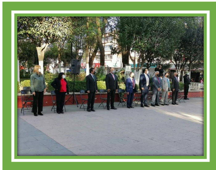
Con mis compañeros Regidores en la celebración del Día de la Bandera.