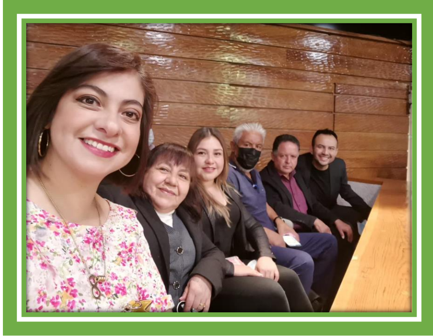
En las Instalaciones del Congreso del Estado con mis compañeros Regidores en el 8º Parlamento Infantil Hidalgo 2022.