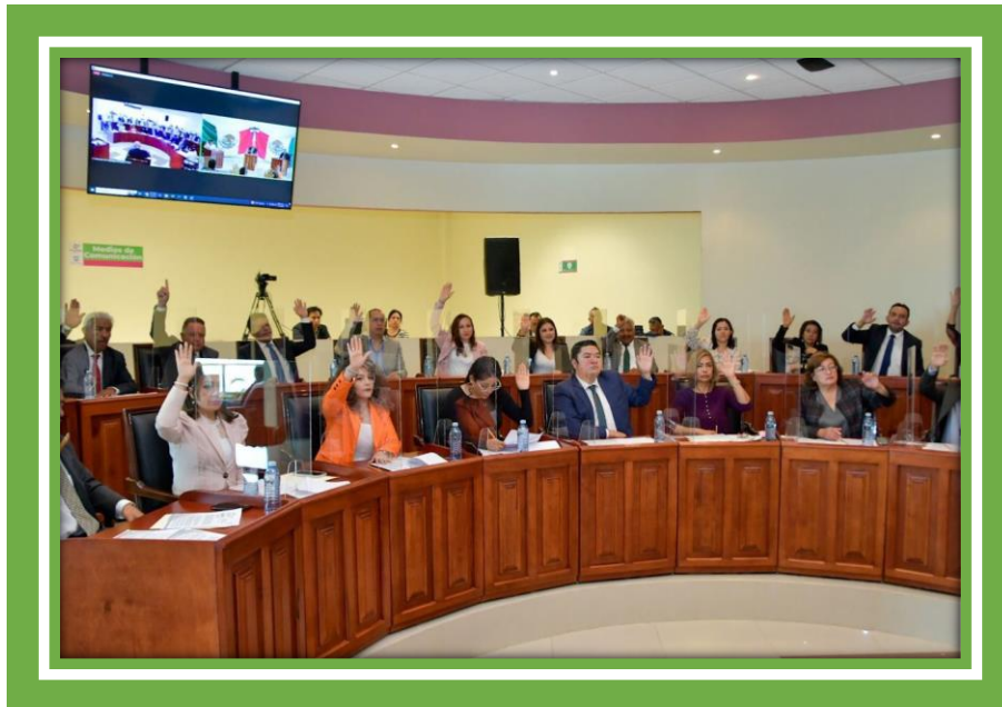
SESIONES H. ASAMBLEA MUNICIPAL