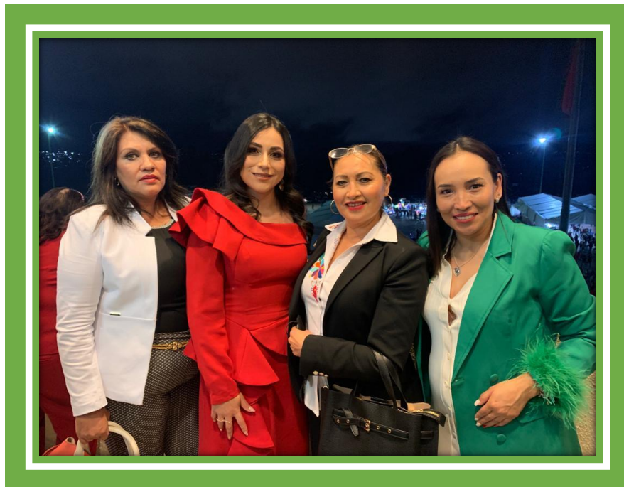
Celebración del Tradicional Grito de Independencia.