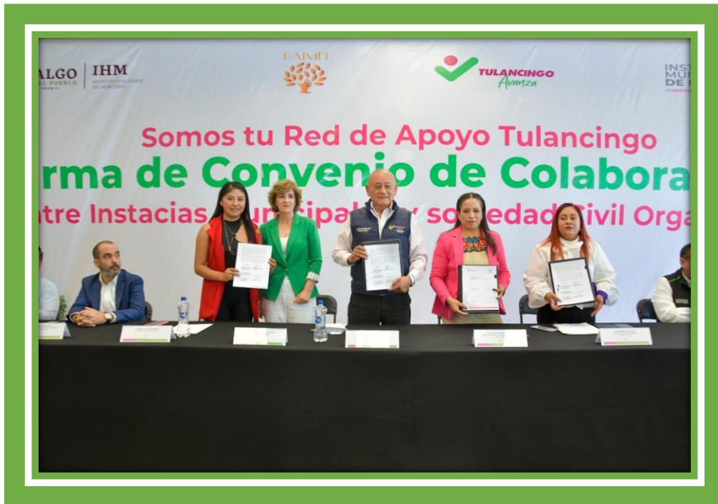
Acompañé al Presidente Municipal a la Firma del Convenio de Colaboración entre Instancias Municipales y Sociedad Civil Organizada Somos tu Red de Apoyo Tulancingo.