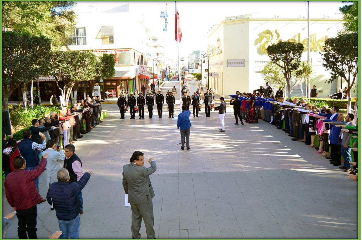
Acudí junto con mis compañeros Regidores a la Celebración del Día de la Bandera.