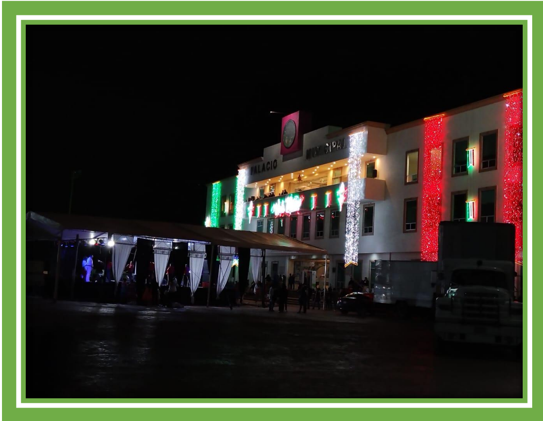
Se llevó a cabo la celebración del tradicional Grito de Independencia en las Instalaciones de la Presidencia Municipal de Tulancingo Hidalgo.