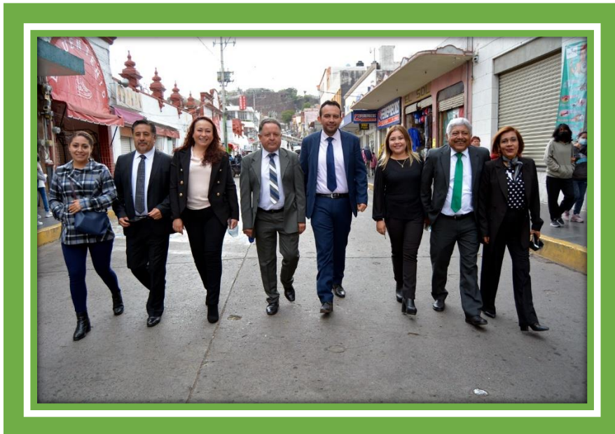
Acudí con mis compañeros Regidores a la Celebración del Desfile de la Independencia de México.