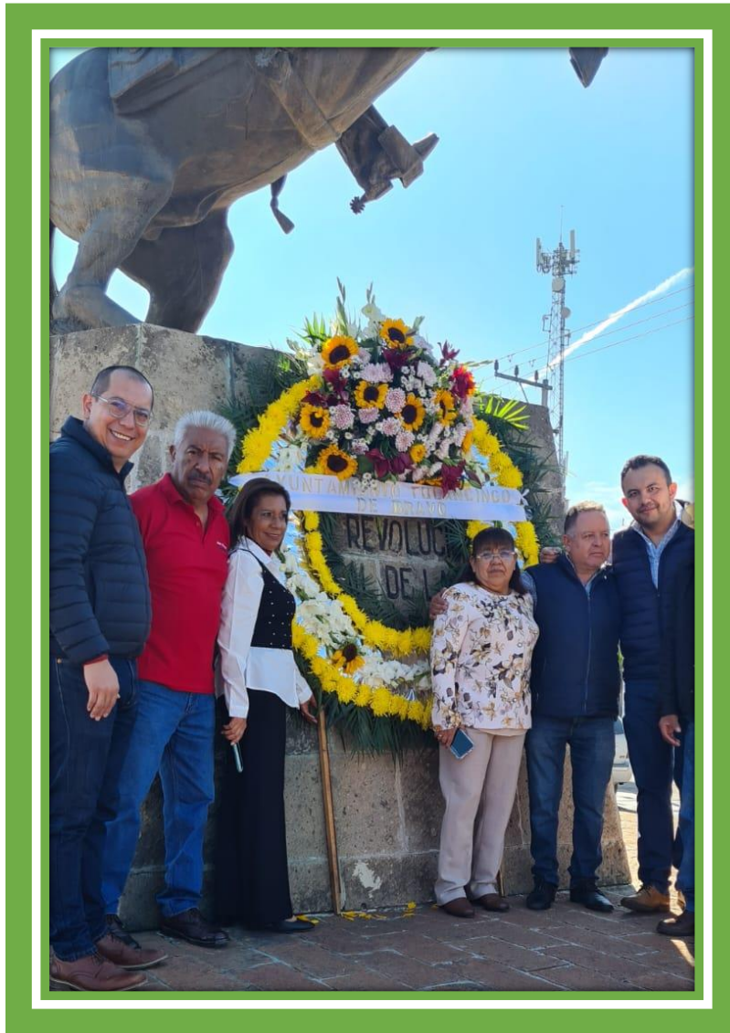
Con mis compañeros Regidores en la guardia de Honor en el CXLIV Aniversario del Natalicio del General Emiliano Zapata.