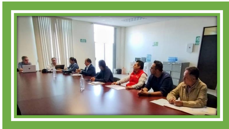
Reuniones de Trabajo