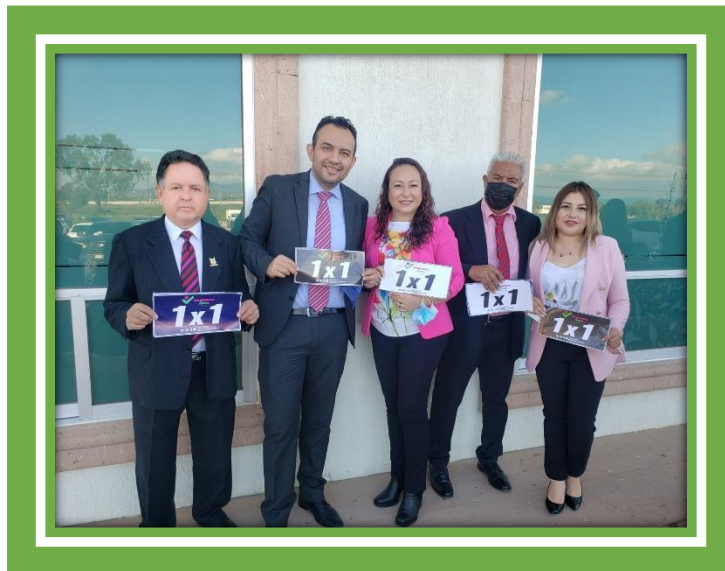
Con mis compañeros Regidores en la presentación del programa 1 x 1 a cargo de la Secretaria de Movilidad y Transporte.