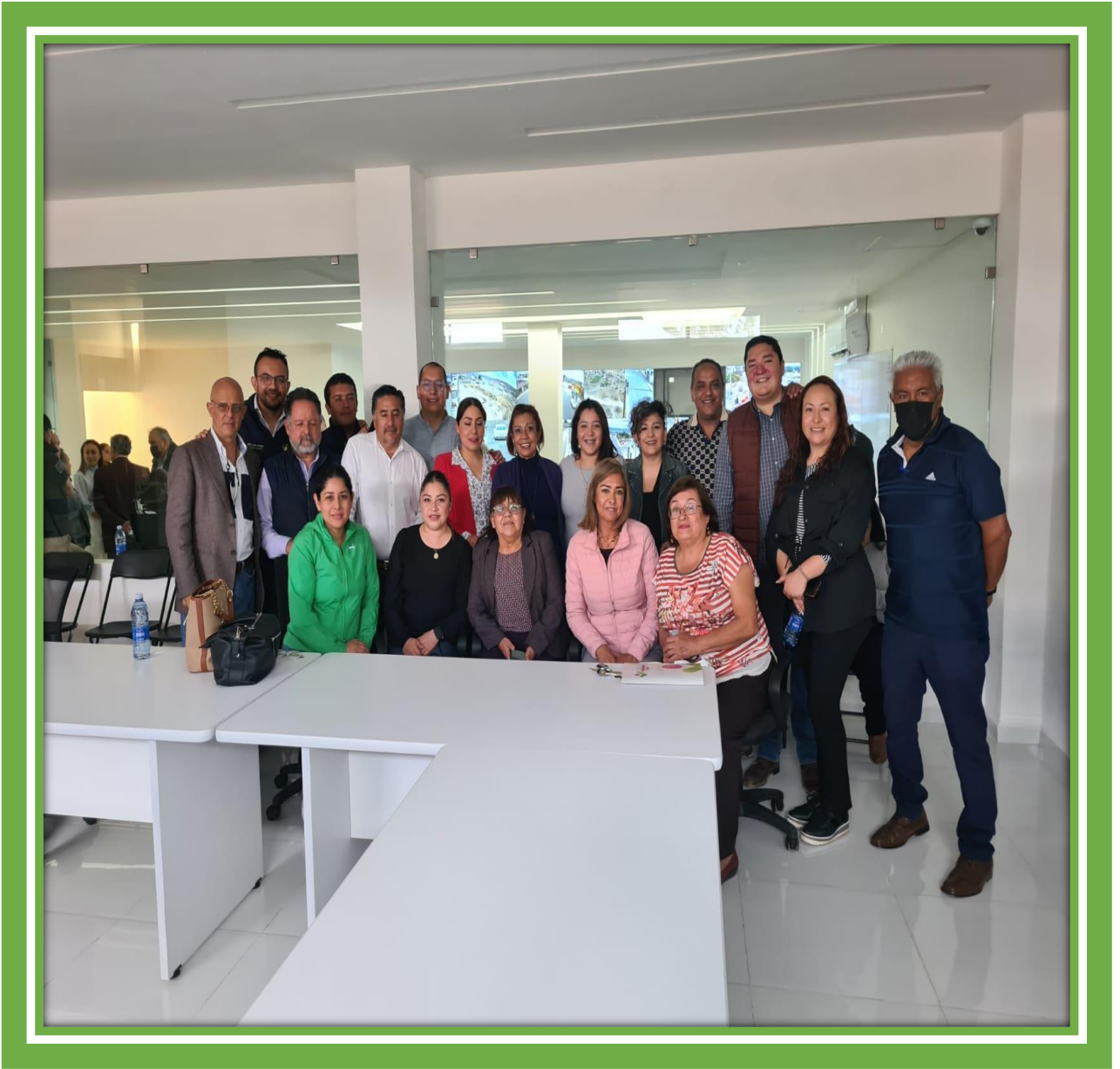
Con mis compañeros Regidores durante el recorrido realizado en las Instalaciones del Cuartel de Seguridad Pública Municipal e Instalaciones del C-4 I.