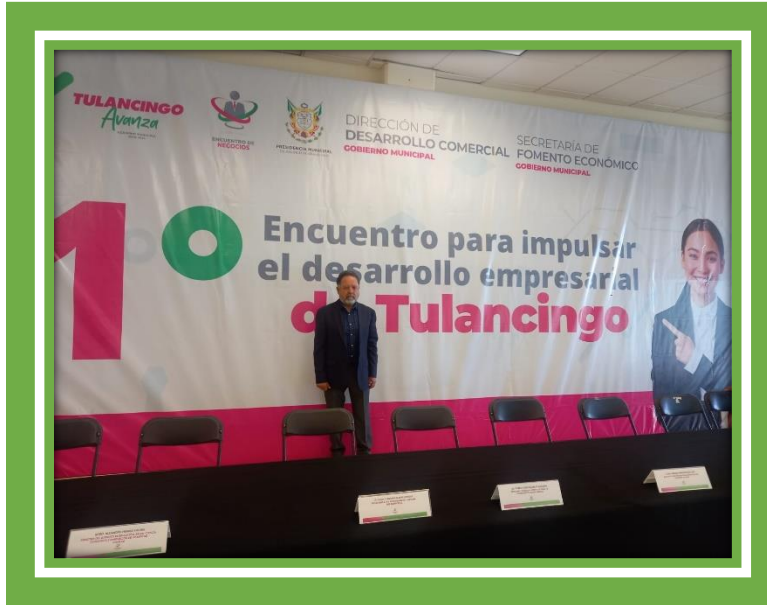
Acudí al 1º Encuentro para impulsar el desarrollo empresarial de Tulancingo.