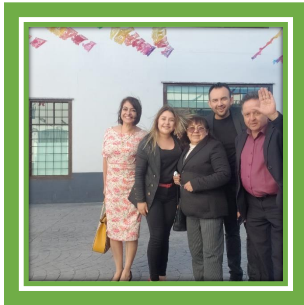
Se llevó a cabo el Parlamento Infantil Hidalgo 2022.