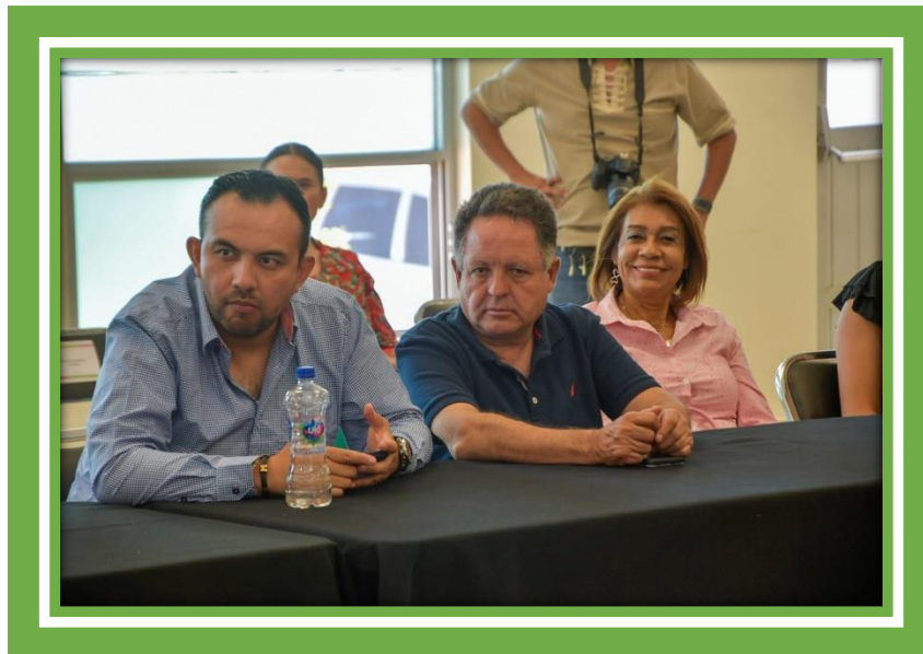
Con mis compañeros Regidores en la Celebración de la Firma del Convenio de colaboración entre Instancias Municipales y Sociedad Civil Organizada Somos tu Red de Apoyo Tulancingo.