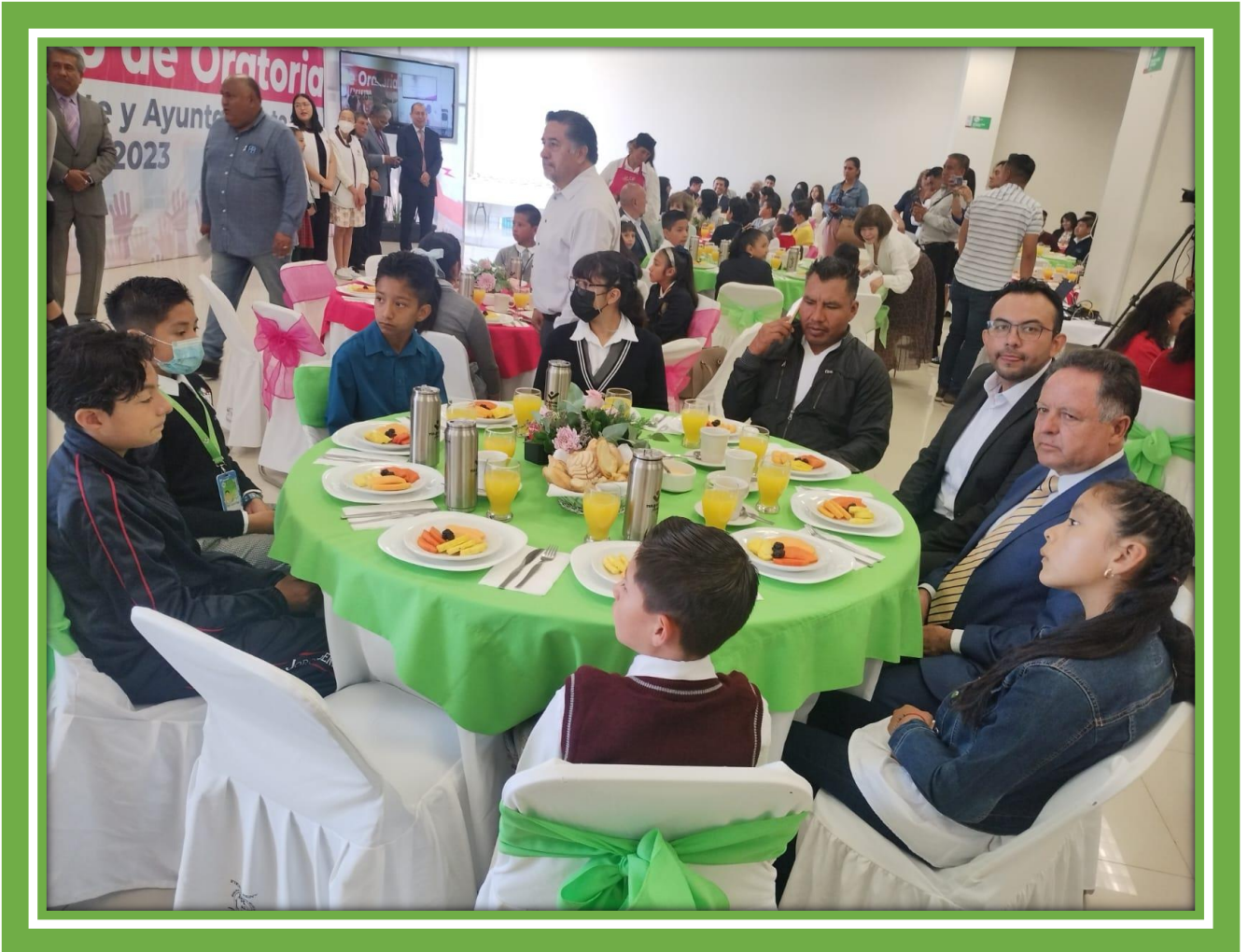
Con mis compañeros Regidores y Alumnos en la Celebración del Primer Concurso de Oratoria Presidenta o Presidente y Ayuntamiento por un día 2023 con la participación de alumnos de nivel Primaria, Secundaria y Bachillerato de las diferentes Instituciones Educativas del Municipio de Tulancingo Hidalgo.